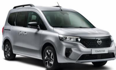
Gyöngyház szürke KQA – 165.100 Ft