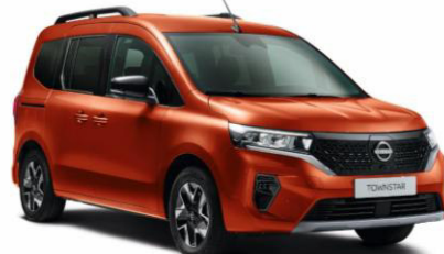
Terrakotta CNZ – 165.100 Ft