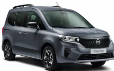
Szürke KPW – 88.900 Ft