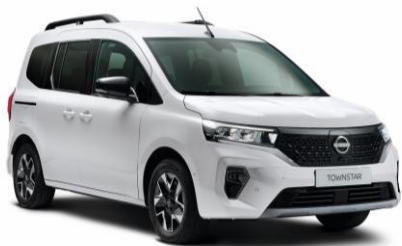
Fehér QNG – 0 Ft