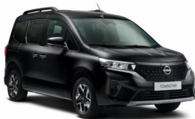
Enigma fekete GNE – 165.100 Ft