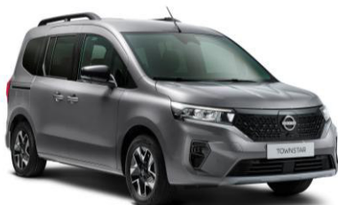
Casiopee Szürke KNG – 165.100 Ft