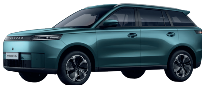
ALPESI ZÖLD (LQ)