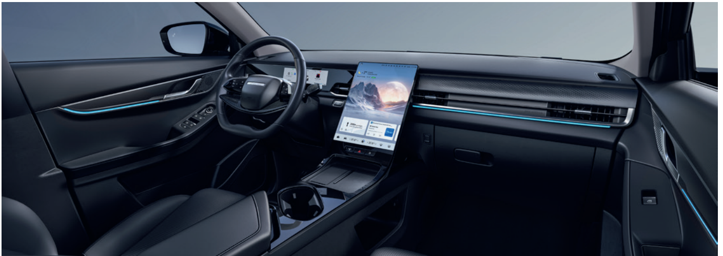
FEKETE SZINTETIKUS BŐR