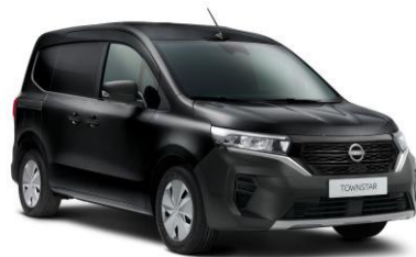
Enigma fekete GNE – 130.000 Ft*