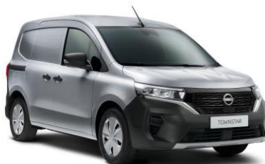
Gyöngyház szürke KQA – 130.000 Ft*