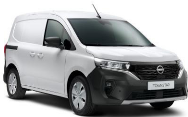
Fehér QNG – 0 Ft*