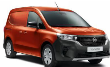
Terrakotta CNZ – 130.000 Ft*

*- a megjelenített árak ÁFA nélkül értendők