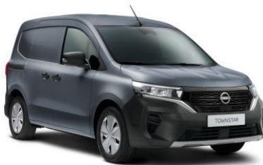
Szürke KPW – 70.000 Ft*